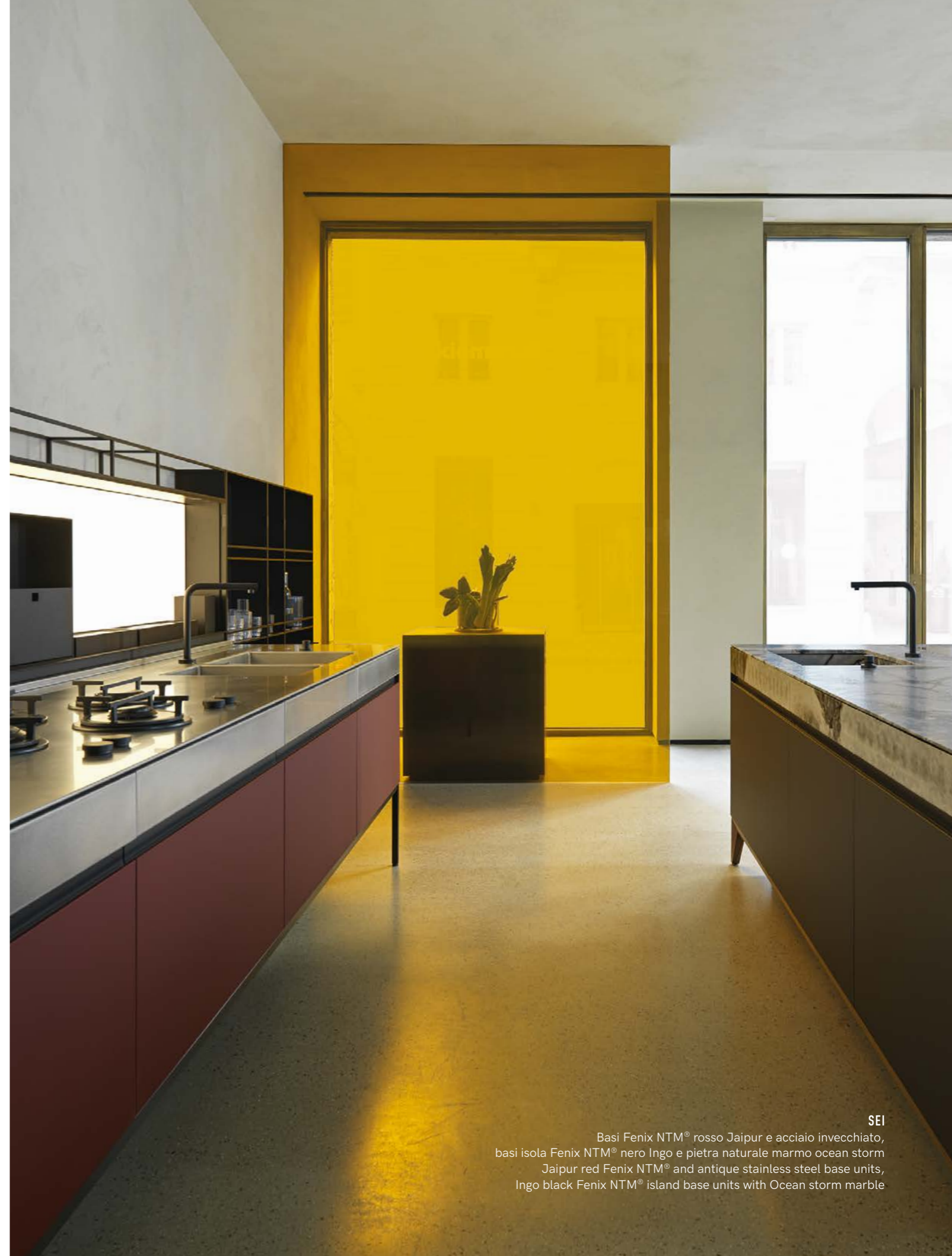
SEI Basi Fenix NTM® rosso Jaipur e acciaio invecchiato, basi isola Fenix NTM® nero Ingo e pietra naturale marmo ocean storm Jaipur red Fenix NTM® and antique stainless steel base units, Ingo black Fenix NTM® island base units with Ocean storm marble