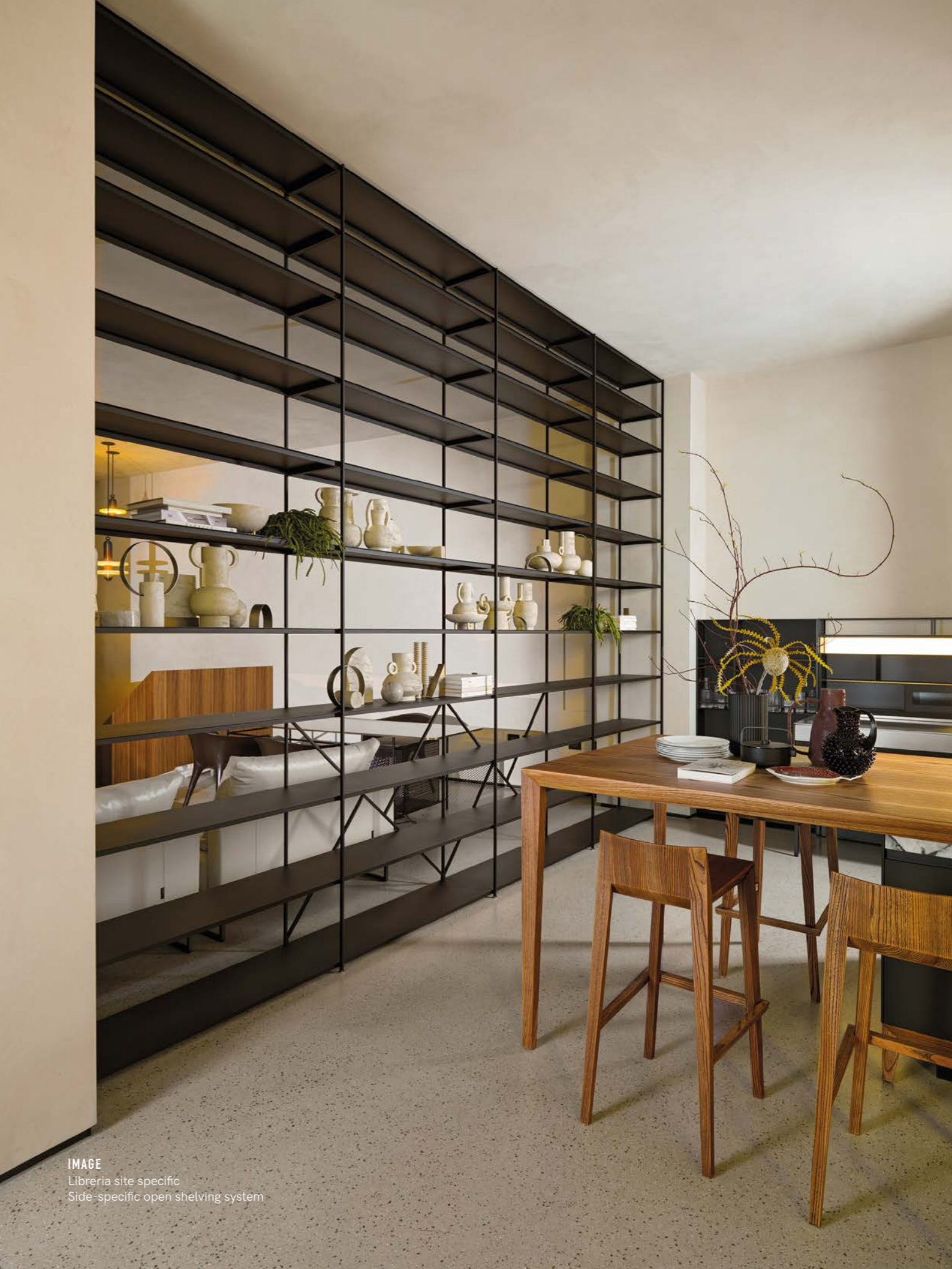
IMAGE Libreria site specific Side-specific open shelving system